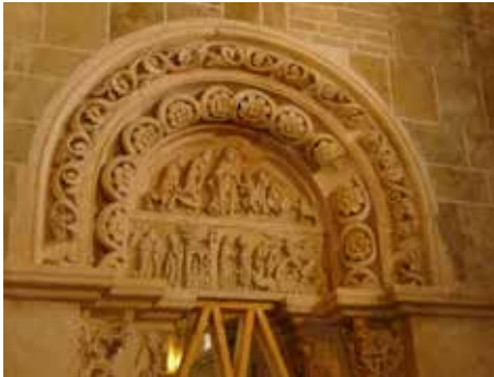
▲ Tympan portail latéral droit

Et qui dit grimpette pensera descente au ralenti et curieuse dans les vieilles ruelles de Vezeley ... découverte de vieux pressoirs.