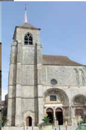
Collégiale St Lazare