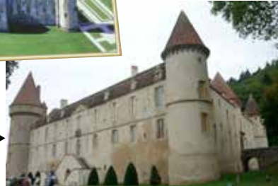
...vue générale ▶

Sur la route du retour, petite halte à l'église «Notre Dame de Saint Père», véritable joyau de l'art gothique (13-15 èmes ), une «cathédrale gothique en miniature» selon P.Mérimée, avec son curieux porche à trois portails.