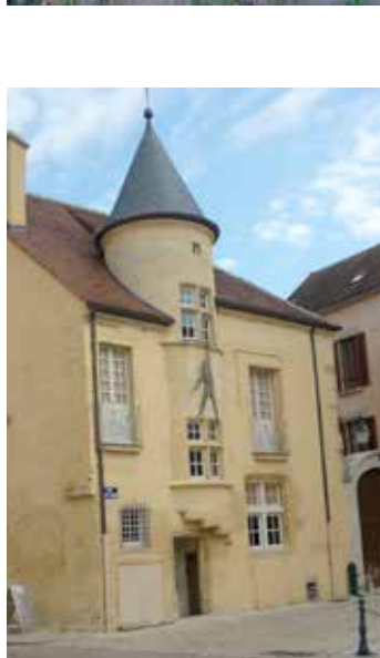
Maison Sires de Domécý