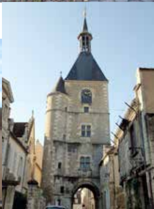
Tour de l'Horloge