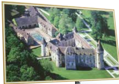
▲ Le chateau .... vue aérienne

Son plus célèbre propriétaire fut le Maréchal. Construit sur l'emplacement d'un ancien poste romain, Vauban en fit une garnison militaire où il ne séjourna qu'entre deux campagnes. Il y construisit une grande galerie pour y installer ses ingénieurs militaires qui réalisaient les plans des nombreuses places-fortes qu'il créait. C'est là qu'il rédigeait entre autres oeuvres la fameuse «Dîme royale» qui causa sa disgrâce.