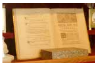
▲ La «Dîme Royale»