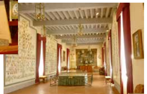
Salle de travail ▶