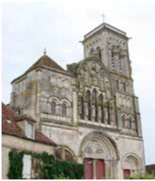
▲ Façade Basilique

Dans la bruine matinale une «grimpette» qui n'a pas effrayé les Agrias, nous menait devant la Basilique Sainte Madeleine de Vezeley. Ancienne abbatale de l'Abbaye de Vezeley, c'est un chef d'oeuvre de l'art roman au IX ème , tant par son architecture que par ses chapiteaux et son portail sculptés.