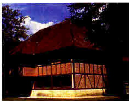
Maison du Parc